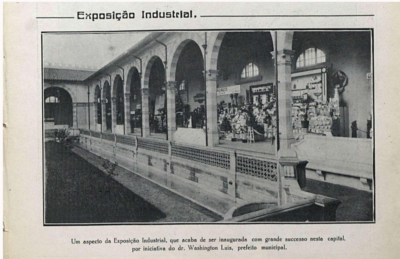
Um aspecto da Exposição Industrial, que acaba de ser inaugurada com grande sucesso nesta capital, por iniciativa do dr. Washington Luis, prefeito municipal.

Na seção da porta principal do Palácio das Indústrias, dedicada ao maquinismo e serviços de fundição, figurava a "Casa da Boia – Rizkallah Jorge – Grande fábrica de artefactos de metal para encanamentos de água, gás, esgoto, arandelas e lustres para luz elétrica" (Correio Paulistano, 1 de outubro de 1917).