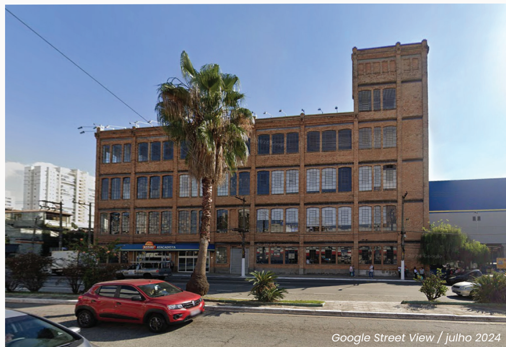
Google Street View / julho 2024